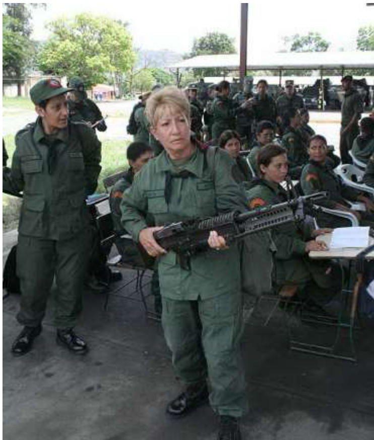
Miliciana con una ametralladora M60 de 7,62x51 mm NATO de la dotación de un blindado 4x4 Dragoon