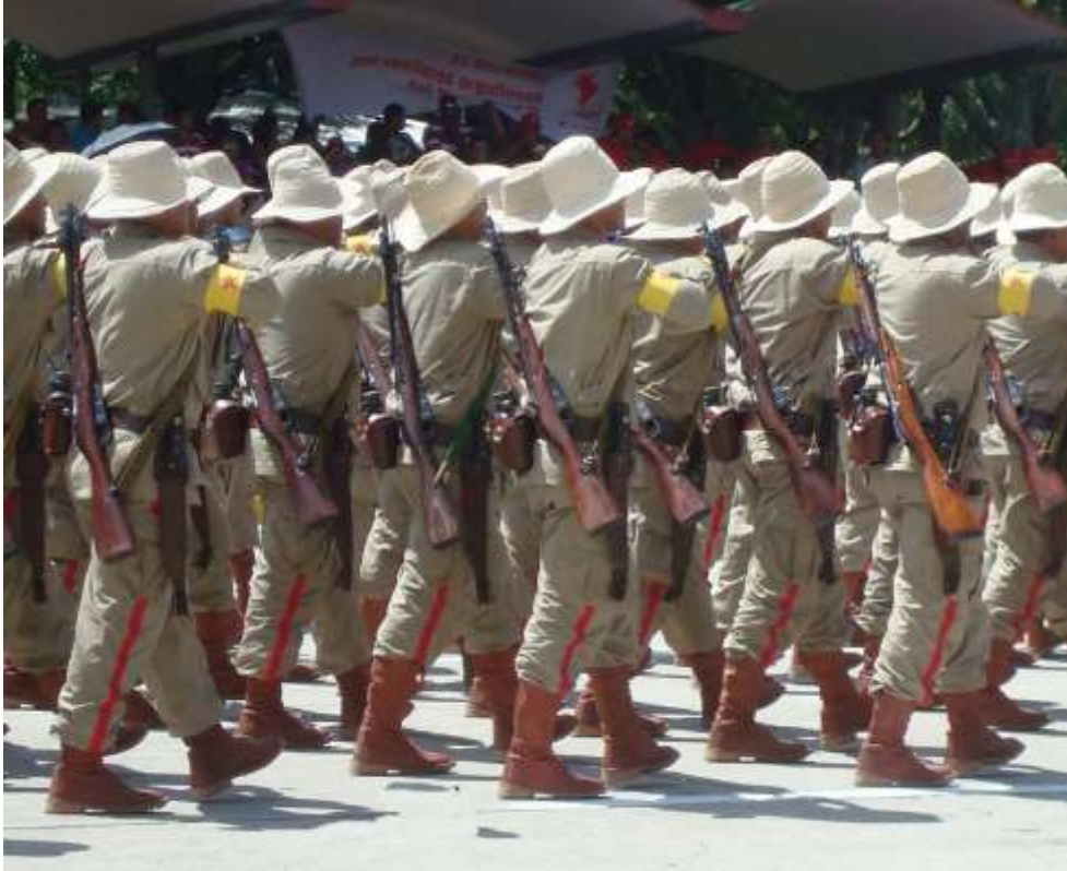
Milicianos campesinos portando fusiles rusos Mosin-Nagant Módele 1891.

función como un fusil de francotirador por el Dragunov (SVD) de 7,62x54R. Las Fuerzas Armadas venezolanas no disponían de fusiles Mosin-Nagant en su inventario, por lo que es de suponer que son de reciente adquisición.