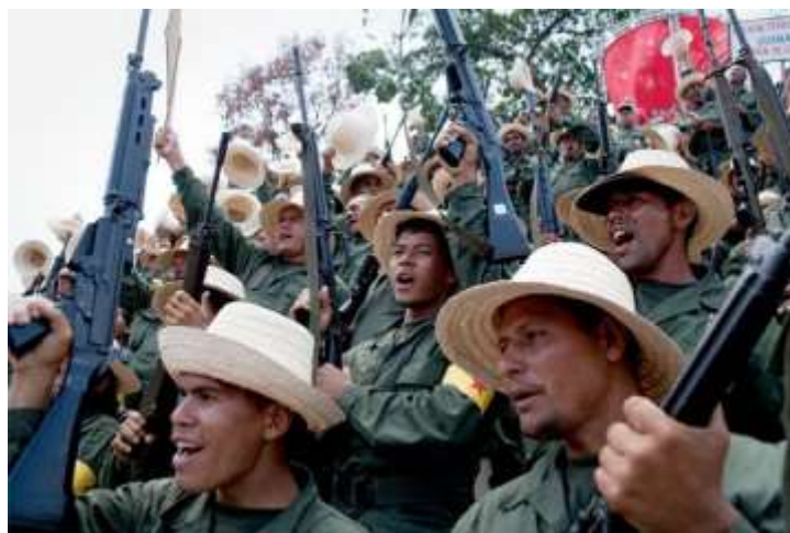
Milicianos campesinos portando fusiles FN FAL

El belga FN Fusil Automatique Léger (FAL) 7,62x51 mm NATO, es, a la fecha, el arma individual reglamentaria de los milicianos. La dotación proviene de los excedentes de la Fuerza Armada Nacional, donde fue reemplazado por el fusil de asalto ruso Kalashnikov AK-103/AK-104 7,62x39 mm.