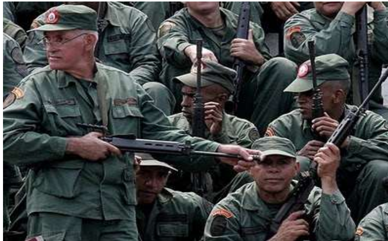
Milicianos territoriales portando fusiles FN FAL

El belga FN Fusil Automatique Léger (FAL) 7,62x51 mm NATO, es, a la fecha, el arma individual reglamentaria de los milicianos. La dotación proviene de los excedentes de la Fuerza Armada Nacional, donde fue reemplazado por el fusil de asalto ruso Kalashnikov AK-103/AK-104 7,62x39 mm.