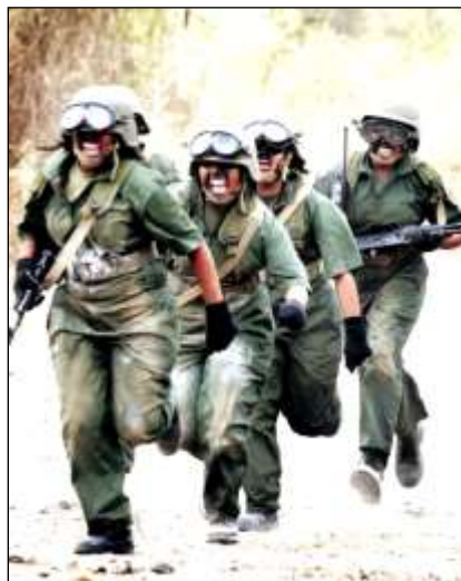
Milicianas portando fusiles Kalashnikov AK-103

Respecto al armamento pesado y medios blindados, sucede lo mismo. A la fecha, no se puede afirmar que la Milicia haya sido dotada de ese tipo de medios. Sin embargo, si existe información gráfica y escrita, sobre el adiestramiento de milicianos, por el Ejército, en el empleo de armamento pesado (individual y colectivo) como lo son: lanzacohetes portátiles antitanque AT4 y Carl Gustaf , de 88 mm; lanzacohetes portátiles antitanque RPG-7V2 de 85 mm; lanzamisiles portátiles antiaéreos Iglá-S, ametralladoras pesadas M2HB de 12,7x99 mm (0.50 calibres), morteros de 81 mm, entre otros.