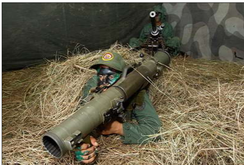
Milicianos con armamento pesado: lanzacohete portátil antitanque Carl Gustaf , de 88 mm y (atrás) ametralladora pesada M2HB de 12,7x99 mm

Respecto al armamento pesado y medios blindados, sucede lo mismo. A la fecha, no se puede afirmar que la Milicia haya sido dotada de ese tipo de medios. Sin embargo, si existe información gráfica y escrita, sobre el adiestramiento de milicianos, por el Ejército, en el empleo de armamento pesado (individual y colectivo) como lo son: lanzacohetes portátiles antitanque AT4 y Carl Gustaf , de 88 mm; lanzacohetes portátiles antitanque RPG-7V2 de 85 mm; lanzamisiles portátiles antiaéreos Iglá-S, ametralladoras pesadas M2HB de 12,7x99 mm (0.50 calibres), morteros de 81 mm, entre otros.